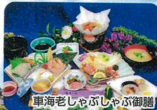
車海老しゃぶしゃぶ御膳